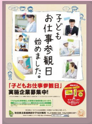
平成26年度 パパ・ママの 職場へようこそ 推進事業