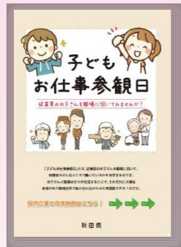
平成28年度 パパ・ママ両立応援 実践事業