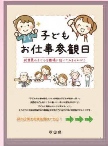
平成27年度 パパ・ママ両立応援 実践事業