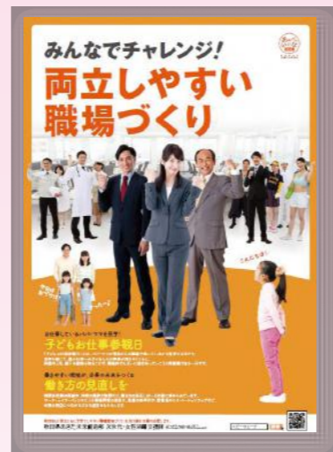
平成29年度 モデル企業による 働くパパ・ママ支援 実践事業