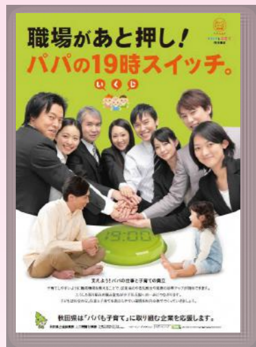
平成28年度 「パパも子育て」 推進事業