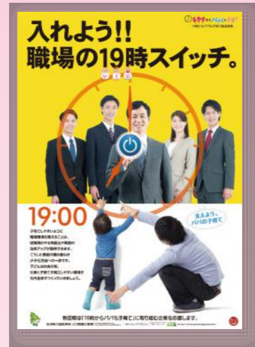
平成27年度 「19時からパパも子育て」 推進事業